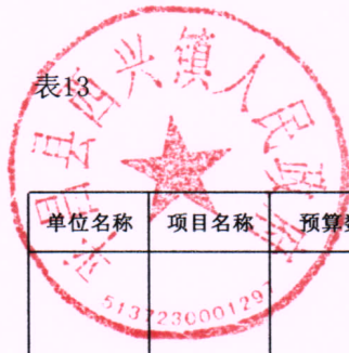
部门预算项目绩效目标表（2024年度）